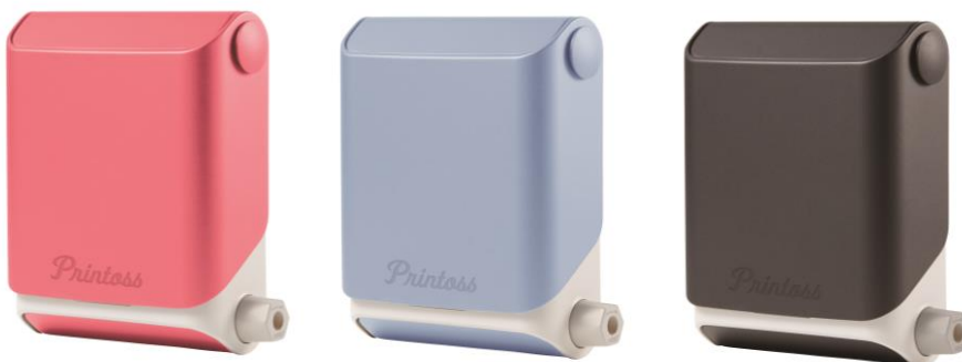
3色展開 左から SAKURA、SORA、SUMI