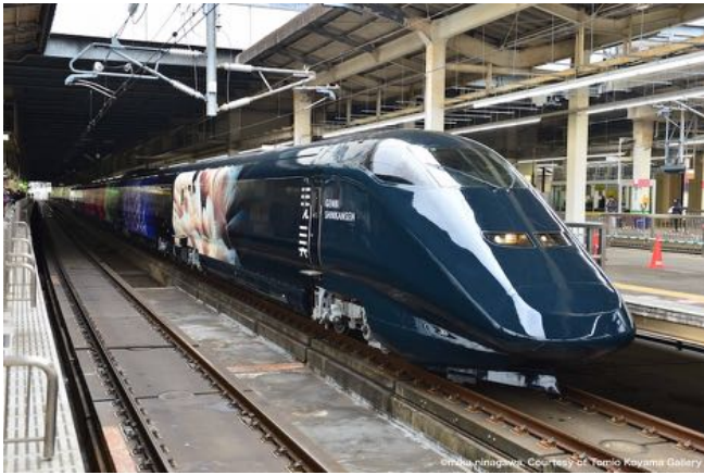
現美新幹線イメージ