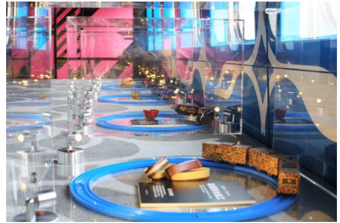
現美新幹線 13号車展示イメージ

なお、本イベント以降は 2018 年 1 月 1 日(月・祝)～8 日(月・祝)の期間、大阪南港 ATC ホールで開催されます『プラレール博 in OSAKA』での展示を予定しております。その他詳細が決定し次第、当社 HP などで公開を予定しております。なお、本作品を販売する予定はございません。