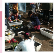
花いっぱい大作戦