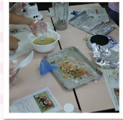
バイオガスの 実験