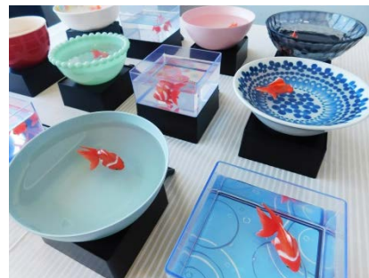
好みの器にも対応

また、付属の水そうの代わりにお椀や陶器など身の回りの器に水を入れて使用することもできるよう工夫しました。気分や使用シーン、インテリアに合わせて、様々な味わいを楽しむことができます。(※容器の厚み、形、サイズなど制限がございます。)