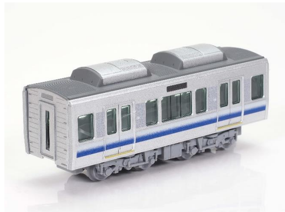
225系5100番代(関空・貴州炉快速) 先頭車／中間車