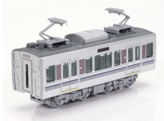
225系100番代(新快速) 先頭車／中間車