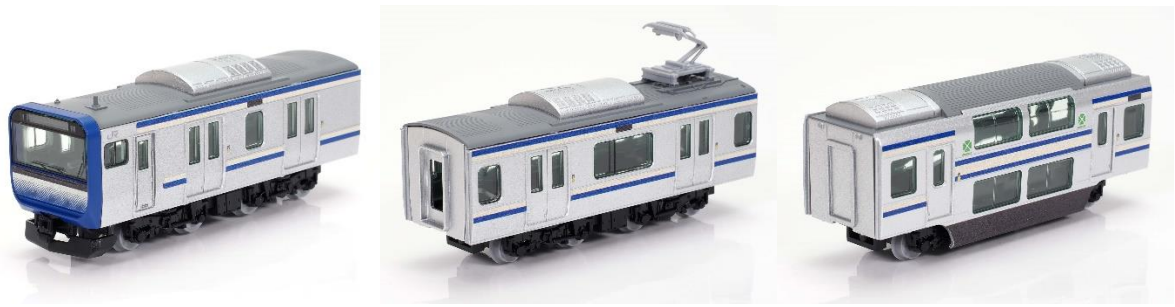
E235系1000番代(横須賀・総武快速線) 先頭車／中間車／グリーン車