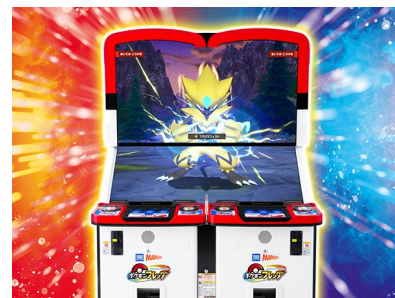
隣接の画面がつながった大迫力のタグプレイ （※画像はイメージになります。）

※「累計プレイ回数」は、コインが筐体に投入された回数を1プレイとして換算しています。