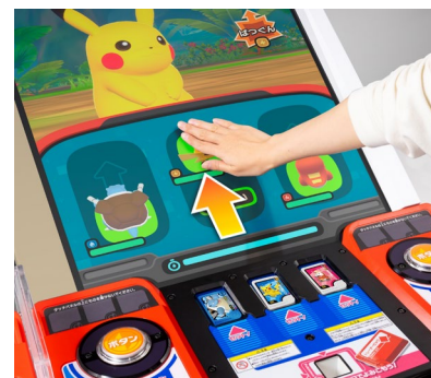
タッチパネル操作イメージ