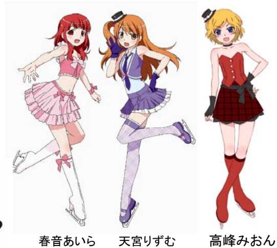
春音あいら 天宮りずむ 高峰みおん

■ストーリー:ダンススケート、おしゃれコーディネート、歌が三位一体になった新しいダンススケートショー『プリズムショー』に出演するプリズムスターは技術・センス・歌唱力、そして人気と、すべてを求められるスーパーアイドル。そのトップ「プリズムクイーン」を目指す女の子「あいら」と「りずむ」が、ときにはケンカしたり、ときには気になる男の子にドキドキしたり、ときには悩んだりしながら、ダンスや、歌や、ファッションセンスを磨いて「プリズムショー」を通してお互いの夢を追いかけてゆくストーリー。