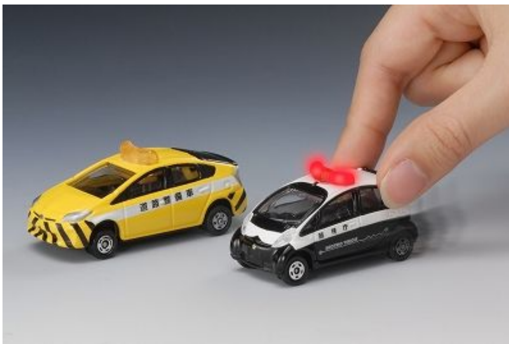
「テコロジートミカ」2種 (左：トヨタ プリウス 道路整備車 / 右：三菱 i-MiEV パトロールカー)

タイヤが通常のトミカと異なりゴムタイヤ仕様の為、「トミカ」商品の一部で遊ぶことができないものがあります。