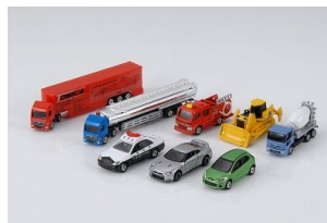
「トミカ」と「トミカ(ロングタイプ)」