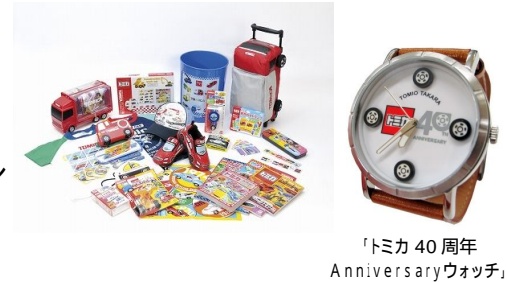
「トミカ 40周年 Anniversaryウォッチ」

トンネルめいろえほん40周年スペシャル / 永岡書店 親子向けTシャツ / モリリン株式会社 親子向けTシャツ / 株式会社ティンカーベル トミカ40周年Anniversaryウォッチ / 株式会社ティンカーベル