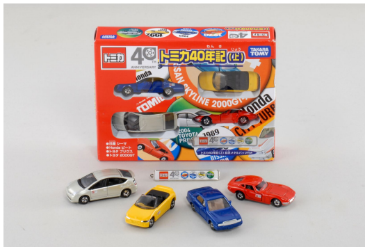
「40周年記念 トミカ40年記(上)」