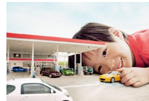
トミカ40周年 キービジュアル