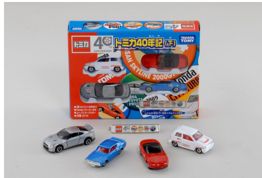
「40周年記念 トミカ40年記(下)」