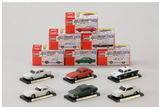
「40周年記念 復刻トミカ Vol.1」 6種

商品名：「40周年記念 復刻トミカ Vol.1」 6種(台座付き) ブルーバード SSSクーペ / コロナ マーク ハードトップ / クラウン スーパーデラックス クラウン パトロールカー / トヨタ 2000GT / フェアレディ Z 432 価格：各500円(税抜価格 477円 税5%) 発売日：2010年4月1日(木)