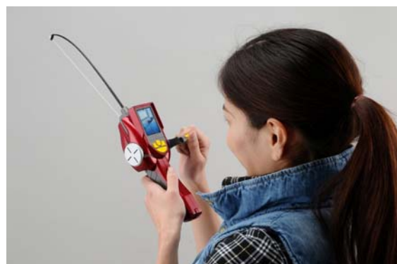
「バーチャルマスターズリアル」使用イメージ