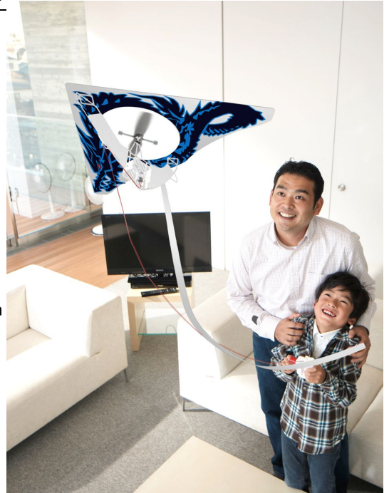
「ホームカイト」使用イメージ

商品名 : 「ホームカイト」 4種 ドラゴンブルー／フェニックスオレンジ／ フレイムレッド／ミリタリーグリーン 希望小売価格 : 各2,940円(税込) (税抜価格 各2,800円 税5%) セット内容 : ウイング(凧)、ボディ、コントローラー、 プロペラ、テイル、テープ、 飛行調整錘、正しい遊び方説明書 商品サイズ : (W)340×(H)180×(D)50mm テイル 600mm 商品重量 : 全体 121g(うち凧 9.7g) 発売日 : 2013年2月28日(木) 対象年齢 : 6歳～ 取扱い場所 : 全国の玩具専門店、百貨店、量販店、 一部雑貨店等 販売目標 : 年度内2万4千個 著作権表記 : (c) TOMY ホームページ : http://www.takaratomy.co.jp/products/homekite/