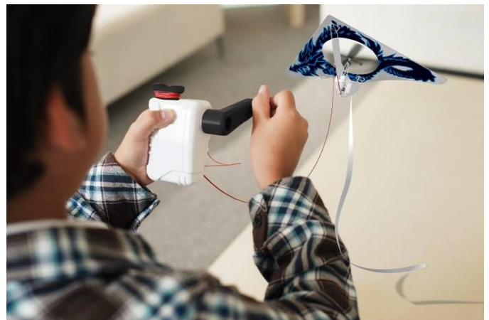
手回し発電で凧を飛ばします

「ホームカイト」は室内で遊べる凧です。コントローラーに内蔵されたモーターをハンドルで回すことで発電し、たこ糸のような細い電線を伝って本体に電気を送ります。その電気で凧(ウイング)のプロペラを回して飛ばします。