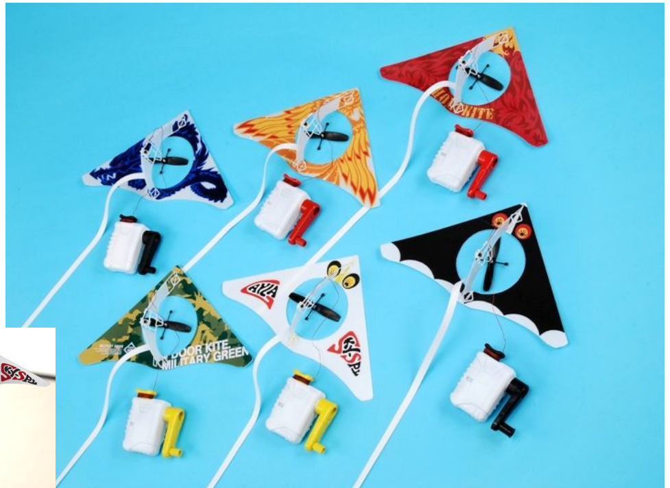
「ホームカイト」 希望小売価格 各2,940円(税込)／全6種 (左上からドラゴンブルー／フェニックスオレンジ／フレイムレッド 左下からミリタリーグリーン／ゲイラ・スカイスパイ／ゲイラベビーバット)