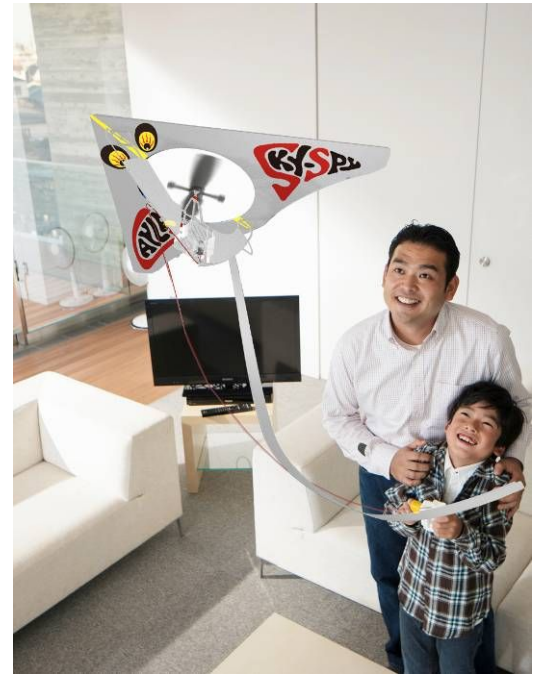
「ホームカイト」使用イメージ