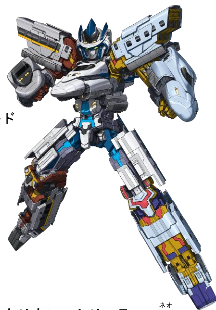
シンカリオン トリニティー ネオ N