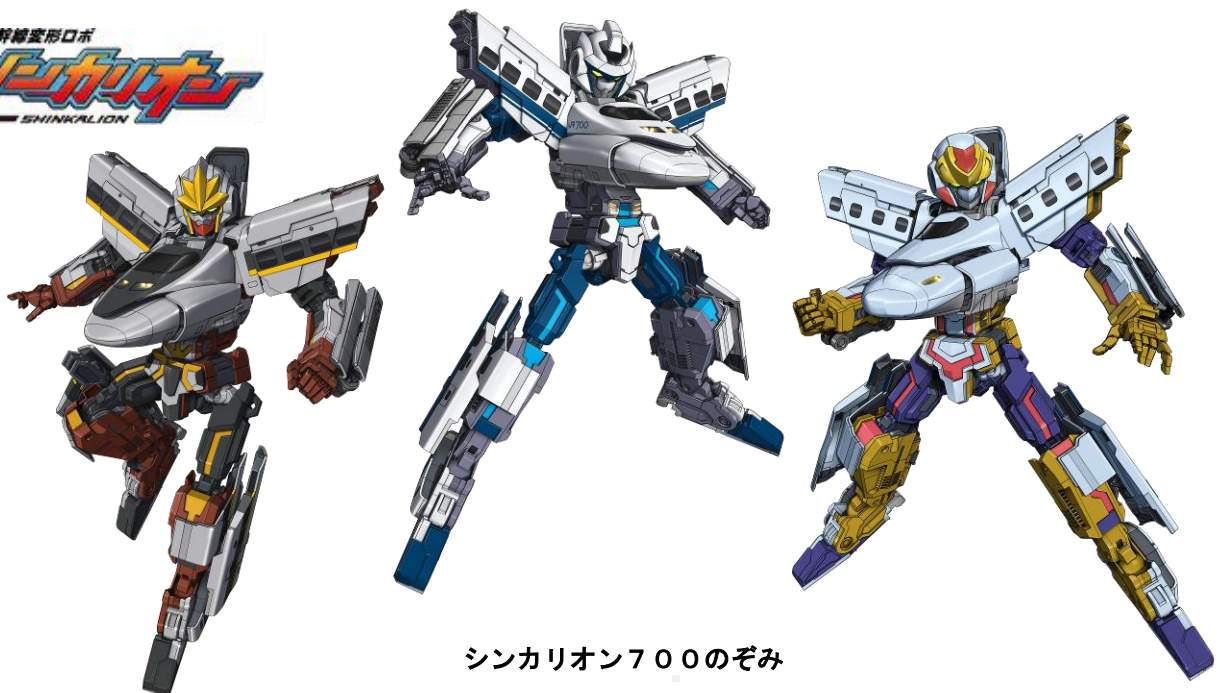
シンカリオン700ひかりレールスター