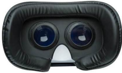
ゴーグル(レンズ側)