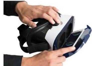
スマートフォン装着イメージ