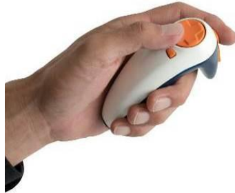
専用コントローラー