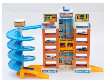
「トミカパーキング」(1981年)