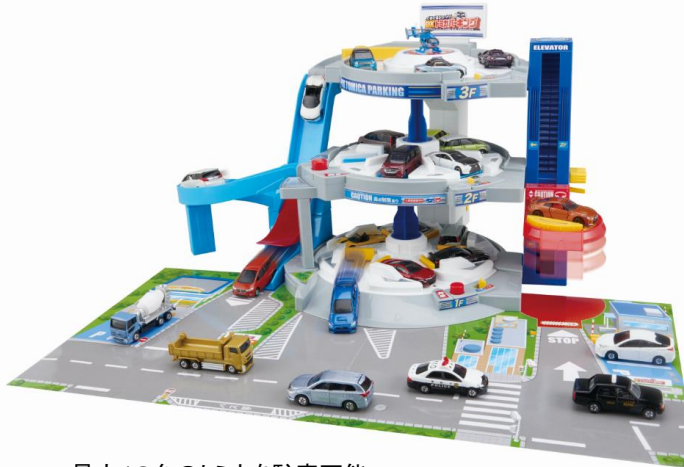
最大18台のトミカを駐車可能

HP： http://www.takaratomy.co.jp/products/tomica/tettei/world/17_02/index.htm