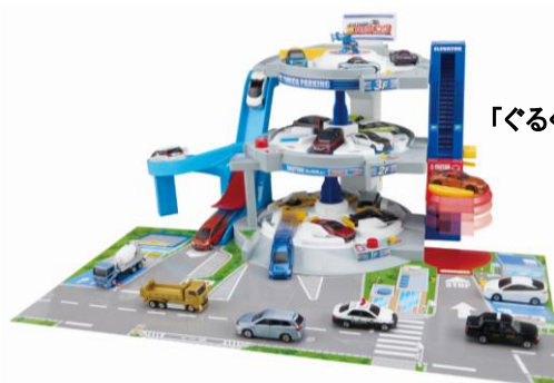
「ぐるぐるシュート!! DXトミカパーキング」

また、お子様から大人までより幅広い年齢層の方に楽しんでいただけるよう、「トミカ」「プラレール」の歴史がわかる展示や大人向け商品の展示、思い出に残る写真をたくさん撮っていただけるようなフォトスポットやカフェなど、ご家族で一日楽しむことができる内容となっています。