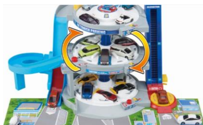
3つの駐車フロアが自動で回転