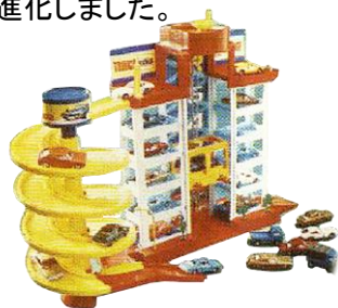
「トミカパーキング」(1972年)

これまでの「トミカパーキング」はエレベーターによる各階への駐車遊びを中心としたビル型の建物をモチーフにしていたのですが、「ぐるぐるシュート!! DXトミカパーキング」では次世代駐車場をイメージした円形駐車場に形状を変え、各フロアが自動で回転するとともに、それぞれ異なる発車機能を搭載した商品として進化しました。