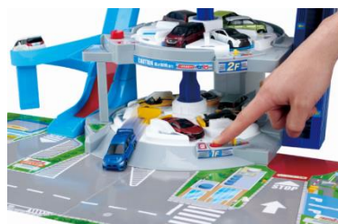
フロアごとに異なる発車ギミック