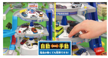
フロアごとに自動・手動の切り替え可能