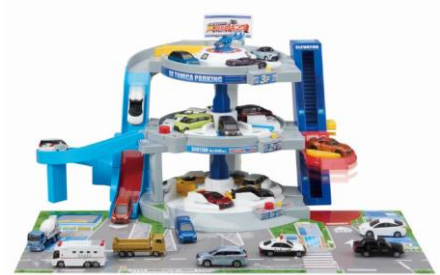
「ぐるぐるシュート!! DXトミカパーキング」