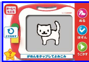
2) アプリを起動して 絵を撮る