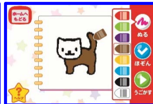
3) アプリの中で 色を塗ることができます