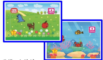
4) 描いた絵が アプリの中で動きだします