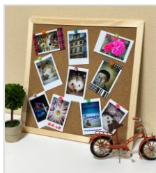
お部屋のデコレーションに！

※5 Photo in Photo (フォトインフォト)・・・写真の中に写真を写す撮影方法。