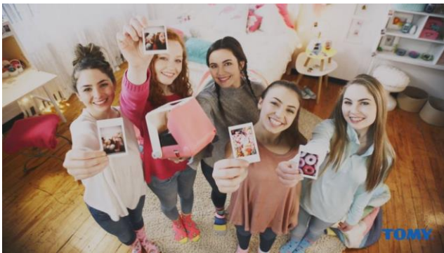
海外で放送予定のプロモーションムービー

海外では、「KiiPix(キーピックス)※2」という名前で発売し、年間100万台の出荷(日本・海外合計)を目標としています。海外の展示会で高い注目を得た「KiiPix」は、大手量販店のカメラ売り場、バラエティショップ、インターネットショップなどでの展開が決定しています。日本同様に SNS 広告を活用したプロモーションも予定しています。