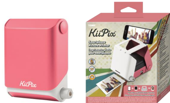
海外で展開予定の商品、パッケージ

「プリントス」は2017年12月の国内発売後、店頭やインターネットショップに入荷後すぐに品切れするなど大きな話題となり、それらの反響を受けて、今回ついに海外での展開が決定しました。