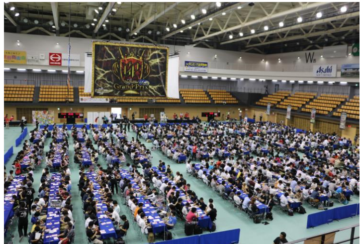
デュエル・マスターズ グランプリ1stの様子

また、店舗やデュエル・マスターズのユーザーが主体となって開催している公認大会「デュエル・マスターズ CS(チャンピオンシップ)」の人気も年々高まっており、8月11日(土)に石川県で開催される「デュエル・マスターズ超 CS II 2018 金沢」も1次受付の定員1,000名のチケットが60分で完売するなど、大人向けの大会は「競技」として楽しみたいコアユーザーから高い支持を得ています。