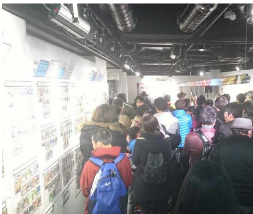
渋谷 GALLERY X での様子

昨年、渋谷「GALLERY X BY PARCO」にて開催し大好評のうちに終了したデュエル・マスターズの展覧会が『デュエル・マスターズ15周年展NEXT』(主催:株式会社パルコ/協力:株式会社小学館)として開催されます。過去に発売された全シリーズのパッケージ及び主要カード展示や原画展示のほか、“超特別ビッグサイズクリーチャー絵巻”と題して「ゴールドベスト切り札絵巻」が超巨大サイズで登場します。また、ここでしか手に入らない入場特典や購入特典に加え、フリー対戦スペースも展開します。