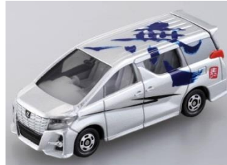
「無」 トヨタ アルファード