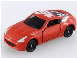
「喝」 日産 フェアレディZ