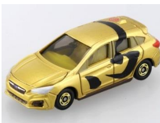
「心」 スバル インプレッサ スポーツ モデル