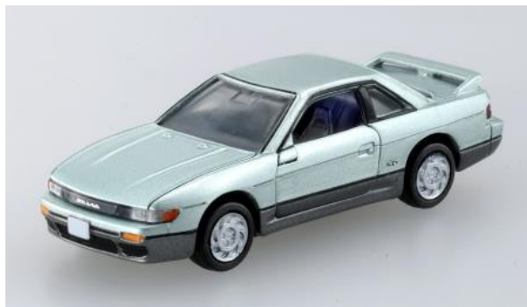
「トミカプレミアム 08 日産 シルビア」 アクション:サスペンション/左右ドア開閉