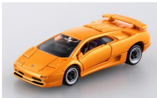
「トミカプレミアム 15 ランボルギーニ ディアブロ SV(トミカプレミアム発売記念仕様)」 アクション:「ランボルギーニ ディアブロ SV」同様