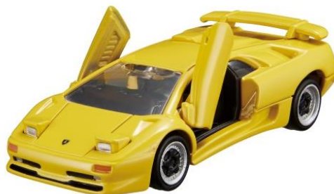
「トミカプレミアム 15 ランボルギーニ ディアブロ SV」 アクション:左右ドア(シザードア)開閉/ライト(リトラクタブルライト)展開・収納