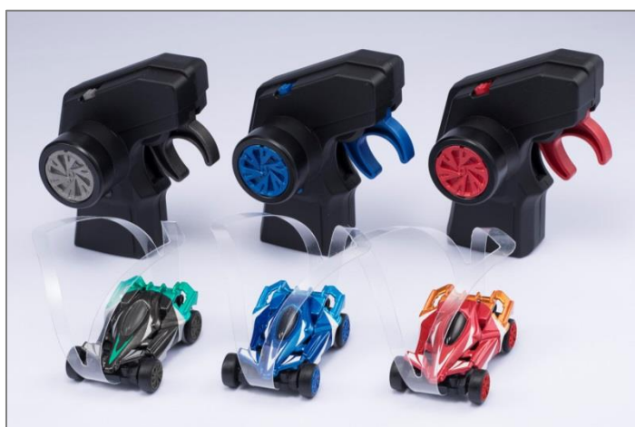
左から：ブラック、ブルー、レッド