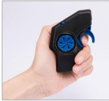
トリガーでスピード調整