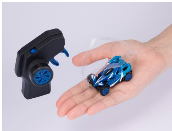
『ギガストリーム』本体（右）とコントローラー（左）