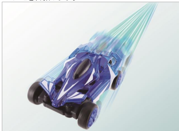
『ギガストリーム』走行イメージ

本商品の開発にあたっては、タカラトミーでこれまで開発してきたラジオコントロールカーの技術やノウハウを結集することで、小型化・軽量化を実現いたしました。日本の技術が詰まった本商品を、今後はグローバルで展開していくことを目指します。