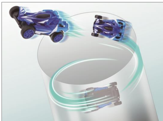
トルネードジャンプ