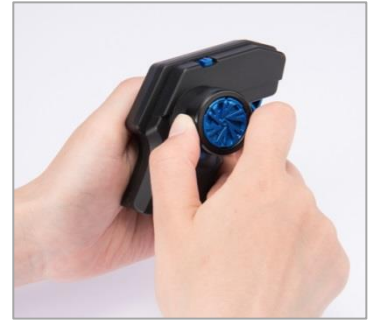
ホイールを回して 進行方向を操作