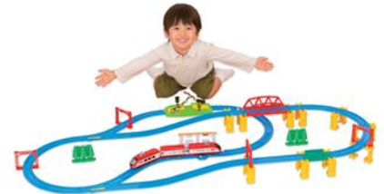
「ルールも！車両も！情景も！ 60周年 ベストセレクションセット」