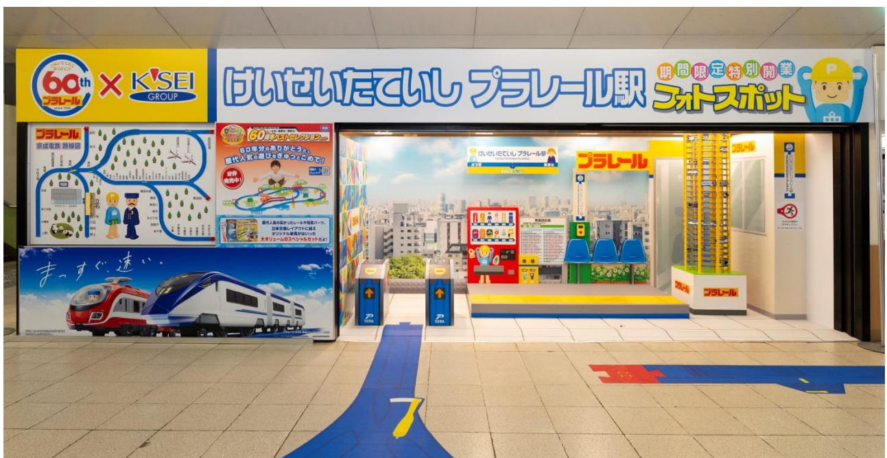
「けいせい たていしプラレール駅」

本企画は、現在「プラレール」で遊んでくださっている小さなお子さまからシニアまで、幅広い世代の方が「鉄道」という共通のテーマのもと一緒に楽しんでいただける場を提供すると同時に、沿線の葛飾区内の駅にも足をお運びいただき、区の魅力にも触れていただきたいという京成電鉄・タカラトミー・葛飾区の想いから実現いたしました。