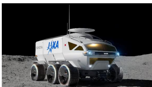
「トヨタ×JAXA 月面有人と圧ローバ」 (実車イメージ画像)

※1)「TOYOTA GAZOO Racing 86/BRZ Race 2019」に参戦中の「tomica ネット兵庫 86BS トヨタ 86」のトミカです。 ※2)トミカの架空の世界観で、「トミカタウン」、「トミカアドベンチャー」、「トミカスピードウェイ」、「トミカフューチャーシティ」など様々なテーマに合わせ、商品展開を行っています。