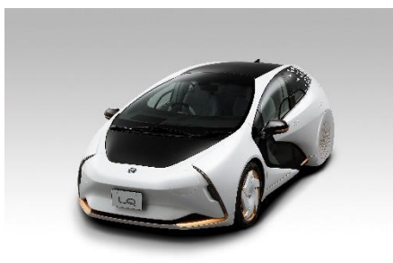
「TOYOTA LQ」 (実車画像)