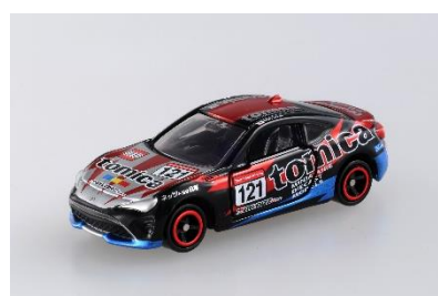
「tomica ネット兵庫 86BS トヨタ 86」 価格: 880円(税込み) ※会場先行発売