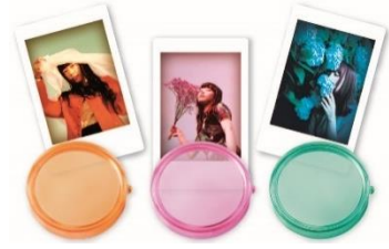
カラーフィルター