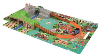
GOGO トーマス おでかけ立体マップ

「車両」「レール」「情景」がセットになっており、パツと開いてすぐに遊べるオールインワンセットです。折りたたむだけで片付けができ、車両も2車両収納可能なため、自宅外に手軽に持ち運ぶことができます。別売りのレールと連結すれば、様々なレイアウトが楽しめます。