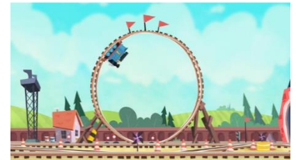
アニメ作中に登場する宙返りシーン