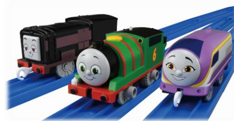
GOGO トーマス パーシー・ディーゼル・カナのおともだちセット