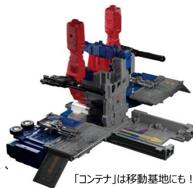
「コンテナ」は移動基地にも！