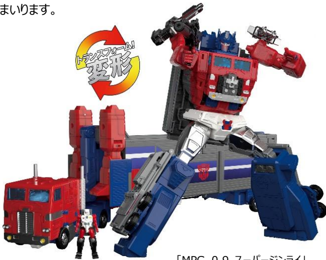
「MPG-09 スーパージンライ」

40周年記念企画として「ゴッドジンライ」プロジェクトを、本日4月10日（水）から始動します。そのほかにも今後、「40周年記念トランスフォーマー展」の開催、企業コラボレーションの実施など、記念イヤーを盛り上げる様々な施策を行ってまいります。