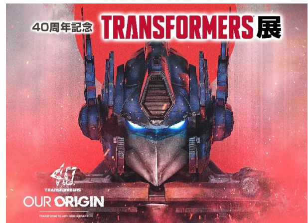
「40周年記念トランスフォーマー展」キービジュアル