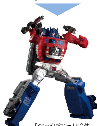
「ジンライ」がコンテナと合体し「スーパージンライ」に！