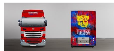
トランスポーターイメージ