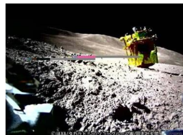
実際のSORA-Qが撮影・送信した月面画像

なお、本商品は宇宙航空の魅力を上での生活へ届けるためのブランド『JAXA LABEL DESIGN』 (※3) 付与商品として発売します。