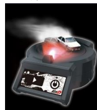
写真下) Lamborghini Edition