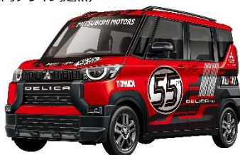
「三菱 デリカミニ トミカ 55 周年記念仕様」