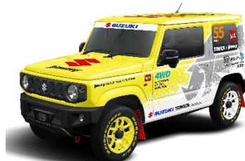
「スズキ ジムニー トミカ 55 周年記念仕様」