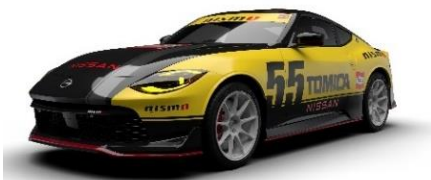
「日産 フェアレディ Z NISMO トミカ 55 周年記念仕様」

デザイン：株式会社テクノアートリサーチ (トヨタ自動車株式会社の国内デザイン拠点)