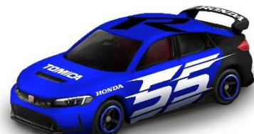
「ホンダ シビック TYPE R トミカ 55 周年記念仕様」