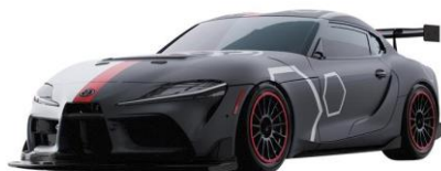
「GR スーパースポーツ GT4 EVO トミカ 55 周年記念仕様」

<商品ラインアップ> ※デザインイメージです。デザインは変更となる場合がございます。画像はトミカではありません。