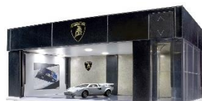
写真上) PREMIUMBLACK Edition