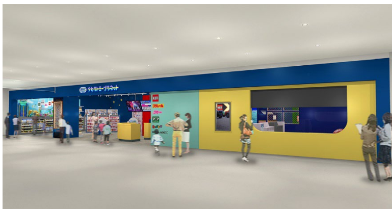
「タカラトミープラネット ららぽーと安城」店舗イメージ

※XR（Extended Reality）…現実世界と仮想世界を融合する技術の総称