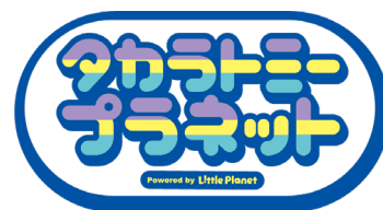
「タカラトミープラネット」ロゴ

※「ベイブレードXRスタジアム / BEYBLADE XR STADIUM」については以下 ©Homura Kawamoto, Hikaru Munro, Posuka Demizu, BBXProject, TV TOKYO © TOMY ©Litpla Inc.