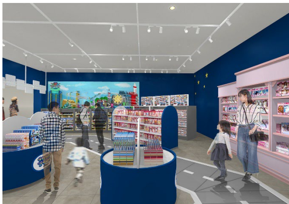
パーク併設のおもちゃ売り場イメージ

「タカラトミープラネット ららぽーと安城」では、「パーク」と「ショップ」の2つの空間を通じて、まるでタカラトミーのおもちゃの世界に入り込んだかのようなイマーシブ（没入型）なアソビ体験を、東海エリアの皆さまにお届けいたします。さらに詳しい情報は2025年4月にリリース予定の第二報でお知らせいたします。