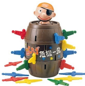
1975年発売 初代「黒ひげ危機一発」

URL： www.takaratomy.co.jp/products/kurohige/50th/