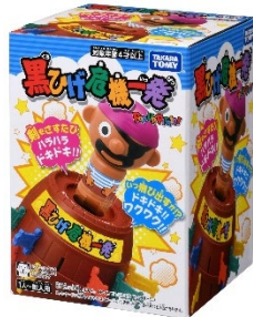
「黒ひげ危機一発」(7代目) パッケージ