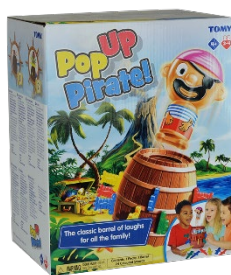
海外版 「Pop up Pirate」パッケージ