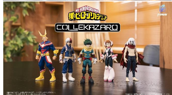
「Q VILLAGE」(写真上) 「COLLEKAZARO」(写真下)