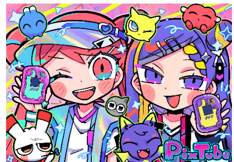
寺田てら描き下ろしオリジナルキャラクター

「PixTube (ピクチューブ)」は、アナログな操作がそのままデジタル表現へとつながる仕掛けが特徴の液晶トイです。レバーをひっぱってはじく方向と連動して光のキャラクターがチューブ内を駆け巡り、お世話やミニゲームが楽しめます。光のキャラクター「ピクメイト」は、Z世代を中心に高い支持を集めるイラストレーター・寺田てらによる描き下ろしのオリジナルキャラクターです。アイスや動物などをモチーフにした、ポップで個性豊かな20種類以上のキャラクターがレバー操作に連動して現れます。