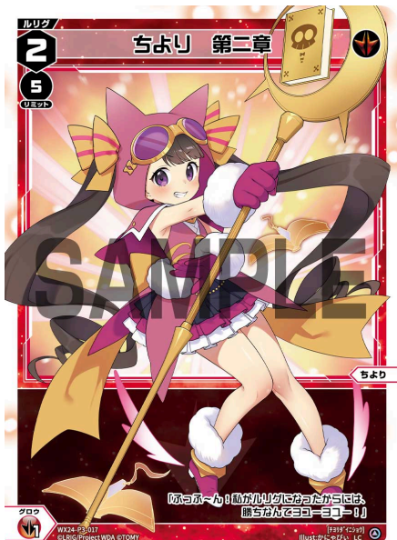
ちより 第二章 赤 ルリグ <ちより> 《赤》×1