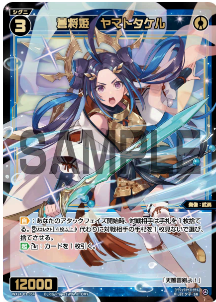
蒼将姫 ヤマトタケル 青 シグニ レベル3 <奏像：武勇> パワー12000

【自】：あなたのアタックフェイズ開始時、対戦相手は手札を1枚捨てる。《リコレクトアイコン》[4枚以上] 代わりに対戦相手の手札を1枚見ないで選び、捨てさせる。 【起】《ダウン》：カードを1枚引く。