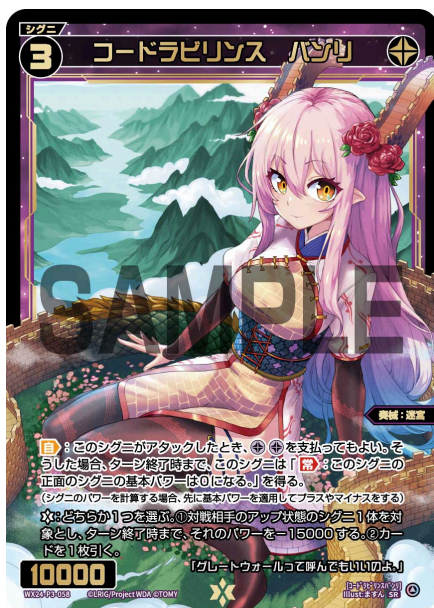
コードラビリンス バンリ 黒 シグニ レベル3 ＜奏械：迷宮＞ パワー10000

A：はい、この効果で支払ったエナも含めて、あなたのトラッシュにある＜悪魔＞のシグニを数えます。