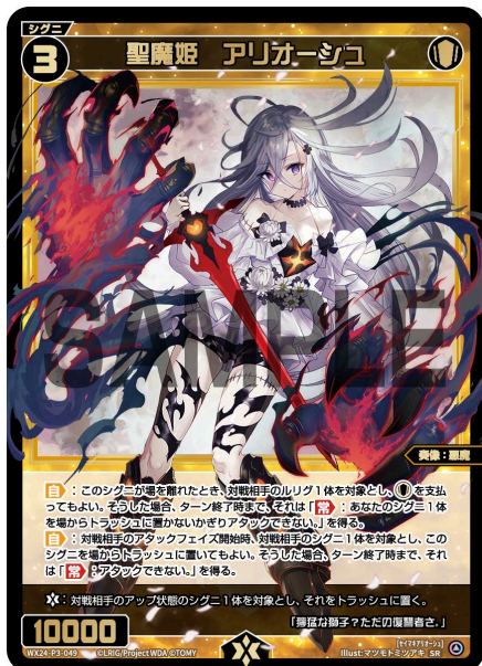
聖魔姫 アリオージュ 白 シグニ レベル3 <奏像：悪魔> パワー10000

【自】：あなたのターン終了時、あなたの他のシグニ1体を対象とし、次の対戦相手のターン終了時まで、そのパワーを+2000する。