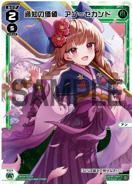
過知の価値 アン=セカンド 緑 ＜アン＞ 《緑》×1