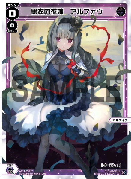
黒衣の花嫁 アルフォウ 黒 ルリグ レベル0 リミット0 ＜アルフォウ＞ 《黒》×0