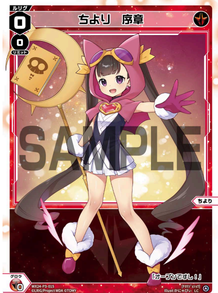
ちより 序章 赤 ルリグ <ちより> 《赤》×0