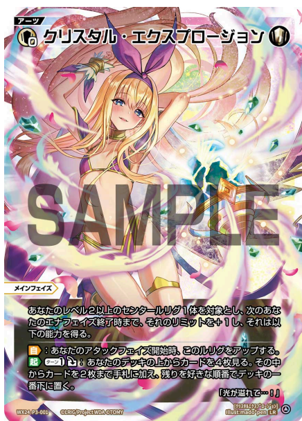
クリスタル・エクспロージョン 白 アーツ《白》×0 メインフェイズ

あなたのレベル2以上のセンタールリグ1体を対象とし、次のあなたのエナフェイズ終了時まで、そのリミットを+1し、それは以下の能力を得る。