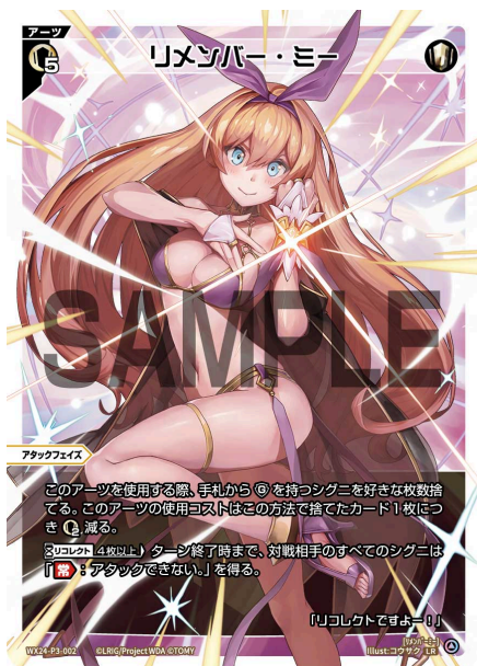
リメンバー・ミー 白 アーツ《白》×5 アタックフェイズ

A：その場合、グロウしたルリグはその能力を持ちません。また、リミットは+1されません。