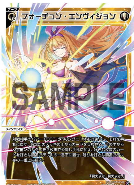
フォーチュン・エンヴィジョン 白 アーツ 《白》×0 メインフェイス

A：いいえ、1回の効果で同時に3枚が移動した場合、パワーを-5000する効果は1回のみトリガーして発動します。