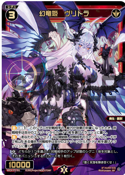
幻竜姫 ヴリトラ 赤 シグニ レベル3 <奏生：龍獣> パワー10000

【自】《ターン1回》：このシグニが対戦相手の、能力か効果の対象になったとき、対戦相手は自分のエナゾーンからカード1枚を選びトラッシュに置く。