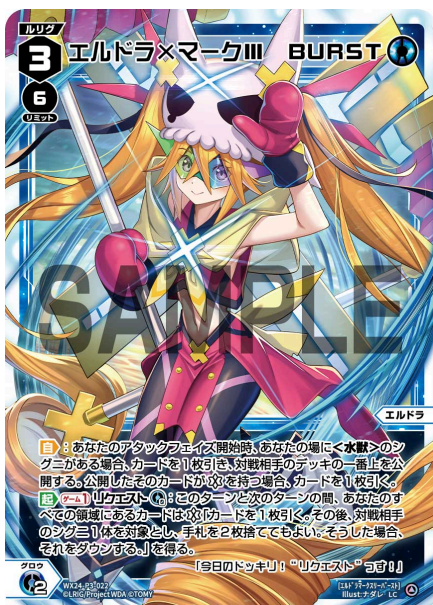
エルドラ×マークIII BURST 青 ＜エルドラ＞ 《青》×2