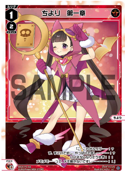
ちより 第一章 赤 ルリグ <ちより> 《赤》×0