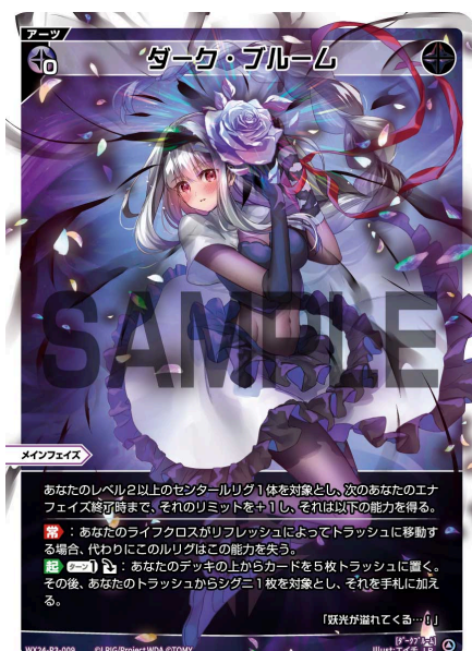
ダーク・ブルーム 黒 アーツ《黒》×0 メインフェイス

A：はい、対戦相手のシグニがアタックするたびにこの能力がトリガーし、そのアタックを無効にしますので、結果的にシグニによるアタックはすべて無効となります。