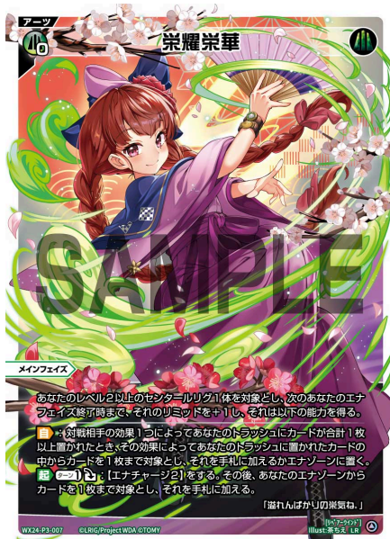
栄耀栄華 緑 アーツ 《緑》×0 メインフェイス

このアーツ自身は使用中まだチェックゾーンに置かれていますのでルリグトラッシュの枚数に数えることはできません。例えばルリグトラッシュにアーツが3枚ある状況でこのアーツを使用しても、条件を満たしていません。