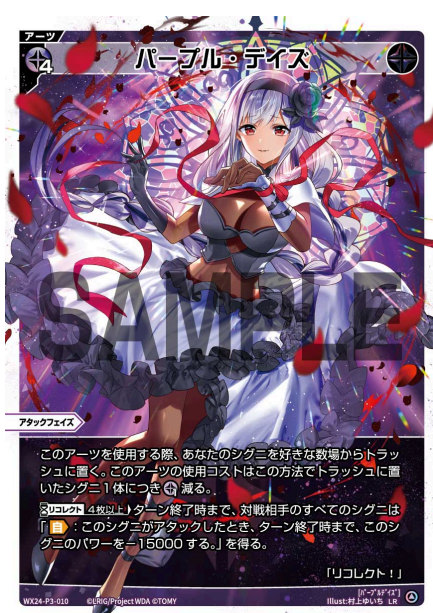
パープル・デイズ 黒 アーツ《黒》×4 アタックフェイス

リフレッシュをする際にライフクロスが無い場合は、ライフクロスをトラッシュに置く処理の部分は何もしませんが、この常時能力も失われません。