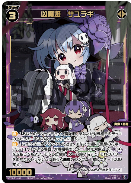
凶魔姫 サユラギ 黒 シグニ レベル3 ＜奏像：悪魔＞ パワー10000

【自】：あなたのアタックフェイズ開始時、あなたか対戦相手のデッキの上からカードを3枚トラッシュに置く。