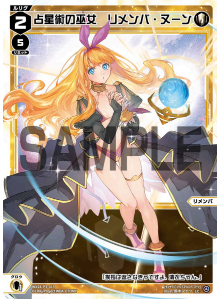
占星術の巫女 リメンバ・ヌーン <リメンバ> 《白》×1