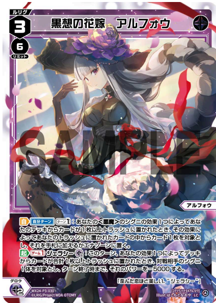
黒想の花嫁 アルフォウ 黒 ルリグ レベル3 リミット6 <アルフォウ> 《黒》×2

【自】《自分ターン》《ターン1回》：あなたの<悪魔>のシグニの効果1つによってあなたのデッキからカードが1枚以上トラッシュに置かれたとき、その効果によってあなたのトラッシュに置かれたカードの中からカード1枚を対象とし、それを手札に加えるかエナゾーンに置く。