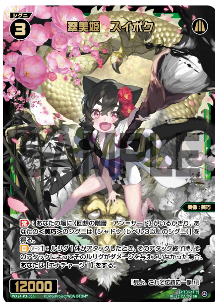
翠美姫 スイボク 緑 シグニ レベル3 <奏像：美巧> パワー12000

A：リコレクトはテキスト内に置かれるアイコンで、《リコレクトアイコン》[4枚以上]のように表記されます。あなたのルリグトラッシュにあるアーツの枚数が指定された条件を満たしていると、後に続く文章が有効になります。