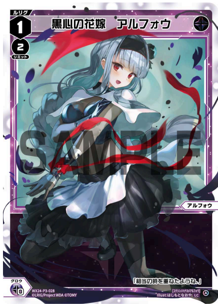
黒心の花嫁 アルフォウ 黒 ルリグ レベル1 リミット2 ＜アルフォウ＞ 《黒》×0