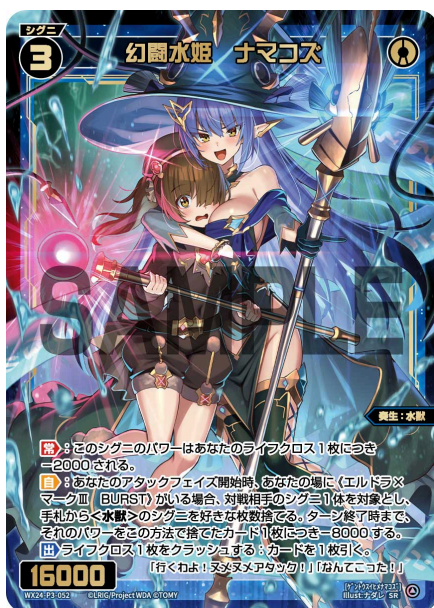
幻闘水姫 ナマコス 青 シグニ レベル3

A：はい、発動します。バニッシュする効果で対象になった時点で《幻竜姫 ヴリトラ》の自動能力がトリガーします。発動するのはバニッシュする効果进行处理した後ですが、トリガーした能力は大元のカードが場を離れていたとしても発動します。