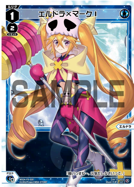
エルドラ×マークI 青 ルリグ ＜エルドラ＞ 《青》×0