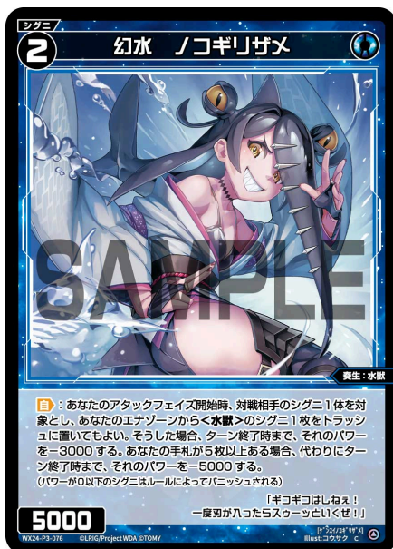
幻水 ノコギリザメ 青 シグニ レベル2 <奏生：水獣> パワー5000

A：その場合、<悪魔>のシグニ3枚がトラッシュに置かれたとしても、デッキがありませんのでカードは引けず効果は終了します。その後、リフレッシュを行います。