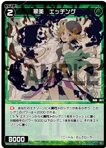
翠美 エッチング 緑 シグニ レベル2 ＜奏像：美巧＞ パワー8000

【常】：あなたのエナゾーンに＜美巧＞のシグニがあるかぎり、このシグニのパワーは+2000される。