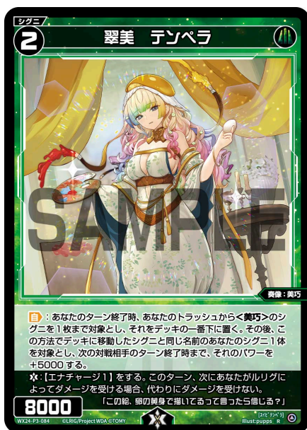
翠美 テンペラ 緑 シグニ レベル2 ＜奏像：美巧＞ パワー8000

【起】《ダウン》エナゾーンから＜美巧＞のシグニ1枚をトラッシュに置く：対戦相手のパワー5000以下のシグニ1体を対象とし、それをエナゾーンに置く。