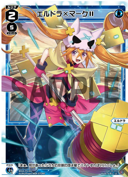
エルドラ×マークII 青 ルリグ ＜エルドラ＞ 《青》×1