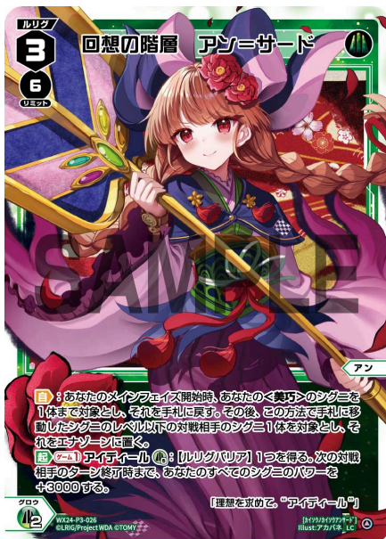
回想の階層 アン=サード 緑 ＜アン＞ 《緑》×2