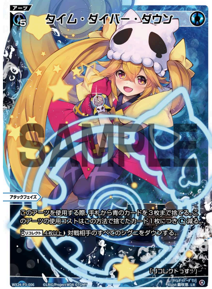
タイム・ダイバー・ダウン 青 アーツ 《青》×5 アタックフェイス

このアーツを使用する際、手札から青のカードを3枚まで捨てる。このアーツの使用コストはこの方法で捨てたカード1枚につき《青×1》減る。