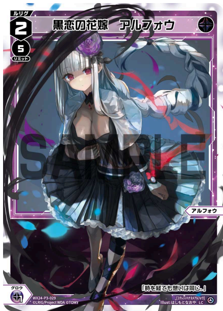
黒恋の花嫁 アルフォウ 黒 ルリグ レベル2 リミット5 ＜アルフォウ＞ 《黒》×1