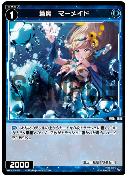
蒼魔 マーメイド 青 シグニ レベル1 <奏像：悪魔> パワー2000

【出】：あなたのデッキの上からカードを3枚トラッシュに置く。この方法で<悪魔>のシグニ3枚がトラッシュに置かれた場合、カードを1枚引く。