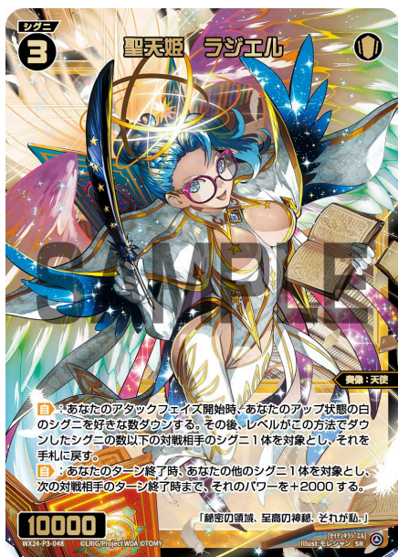
聖天姫 ラジエル 白 シグニ レベル3 <奏像：天使> パワー10000

A：この自動能力を処理した後、公開したカードは裏向きでデッキの一番上に戻します。