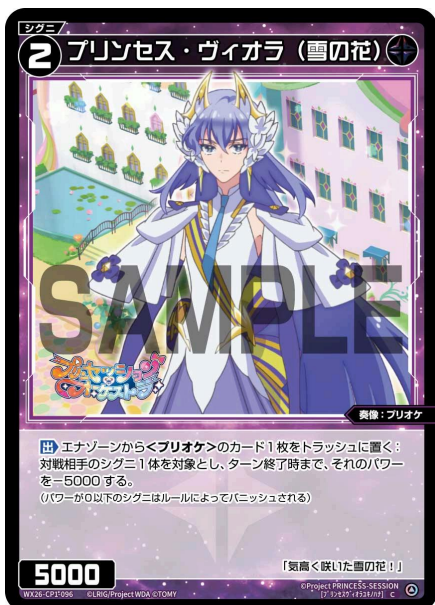
プリンセス・ヴィオラ (雪の花) 黒 シグニ レベル2 <奏像：プリオケ> パワー5000

【起】このシグニを場からトラッシュに置く：あなたの手札から《花の騎士シンシア》1枚を場に出す。