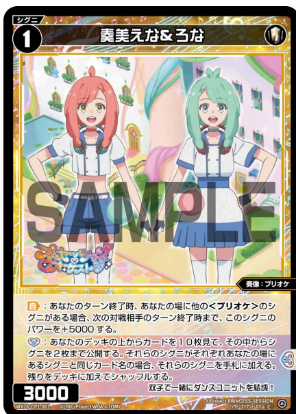
奏美えな&ろな 白 シグニ レベル1 <奏像：プリオケ> パワー3000

A：はい、この効果はシグニを対象としていませんので、【シャドウ】は影響しません。