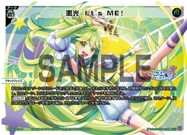
レーザー It's ME! 緑 アーツ 《緑》×1 アタックフェイズ

A：いいえ、できません。効果は上から順番に行いますので、①と②を選んだら①→②の順番で処理します。