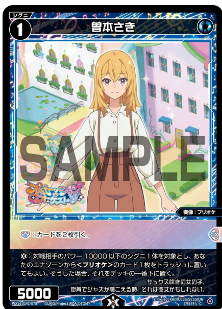
曾本さき 青 シグニ レベル1 <奏像：プリオケ> パワー5000

A：いいえ、《無》《無》を支払うのは任意となります。支払わずに手札が0枚だった場合、何も起こりません。