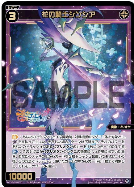
花の騎士シンシア 黒 シグニ レベル3 <奏像：プリオケ> パワー10000

【自】：あなたのアタックフェイズ開始時、対戦相手のシグニ1体を対象とし、《黒》を支払ってもよい。そうした場合、ターン終了時まで、そのパワーをあなたのトラッシュにある<プリオケ>のカード1枚につき-1000する。