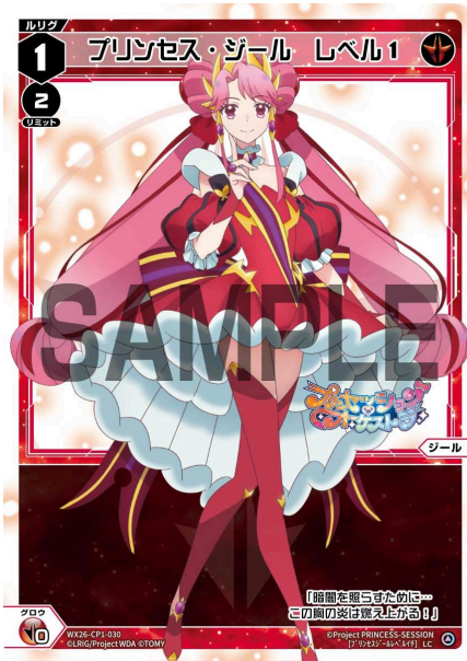
プリンセス・ジール レベル1 <ジール> 《赤》×0