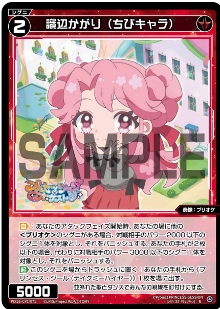
識辺かがり (ちびキャラ) 赤 シグニ レベル2 <奏像: プリオケ> パワー5000

A: シグニには【歌のカケラ】アイコンを持つ能力があることがあります。【歌のカケラ】アイコンを持つ能力は、それ単体では効果は無く、特定のルリグの「【歌のカケラ】を使用する」効果で使用することができます。