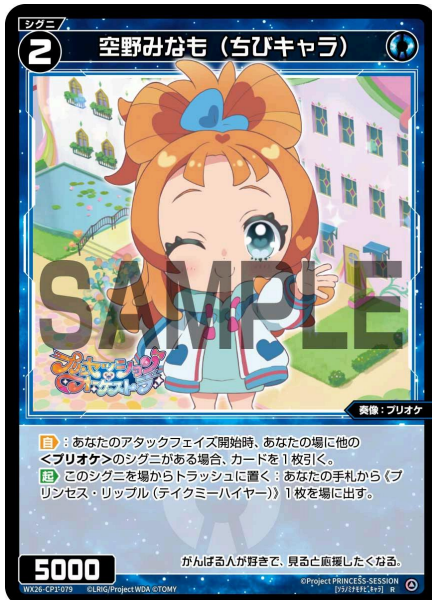
空野みなも (ちびキャラ) 青 シグニ レベル2 <奏像：プリオケ> パワー5000

A：シグニには【歌のカケラ】アイコンを持つ能力があることがあります。【歌のカケラ】アイコンを持つ能力は、それ単体では効果は無く、特定のルリグの「【歌のカケラ】を使用する」効果で使用することができます。