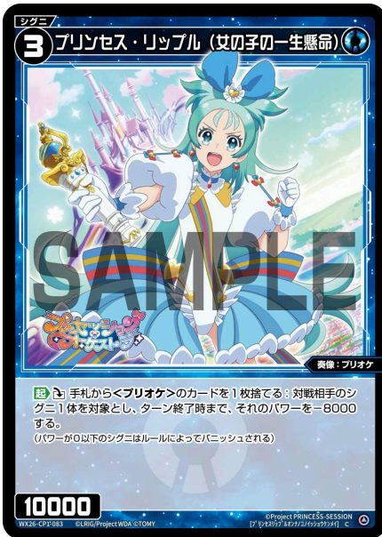
プリンセス・リップル (女の子の一生懸命) 青 シグニ レベル3 <奏像：プリオケ> パワー10000

【起】《ダウン》手札から<プリオケ>のカードを1枚捨てる：対戦相手のシグニ1体を対象とし、ターン終了時まで、そのパワーを-8000する。 (パワーが0以下のシグニはルールによってバニッシュされる)