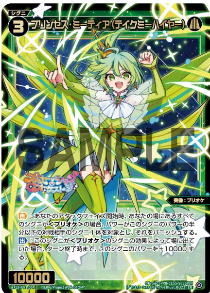
プリンセス・ミーティア (テイクミーハイヤー) 緑 シグニ レベル3 <奏像：プリオケ> パワー10000

A：はい、このシグニ1体だけだった場合も「あなたの場にあるすべてのシグニが<プリオケ>」であるという条件は満たしています。