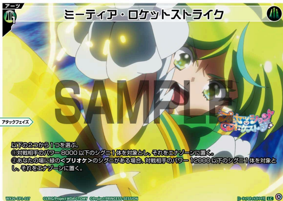
ミーティア・ロケットストライク 緑 アーツ 《緑》×1 アタックフェイス

A：はい、できます。その場合はシグニを対象とする部分は無視し、残りの効果を処理できます。