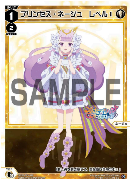
プリンセス・ネージュ レベル1 <ネージュ> 《白》×0