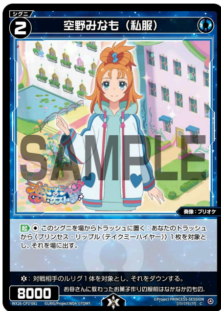
空野みなも (私服) 青 シグニ レベル2 <奏像：プリオケ> パワー8000

【起】《無》このシグニを場からトラッシュに置く：あなたのトラッシュから《プリンセス・リップル (テイクミーハイヤー)》1枚を対象とし、それを場に出す。