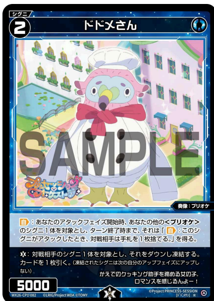
ドドメさん 青 シグニ レベル2 <奏像：プリオケ> パワー5000

【自】：あなたのアタックフェイズ開始時、あなたの他の<プリオケ>のシグニ1体を対象とし、ターン終了時まで、それは「【自】：このシグニがアタックしたとき、対戦相手は手札を1枚捨てる。」を得る。