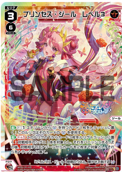
プリンセス・ジール レベル3 <ジール> 《赤》×2