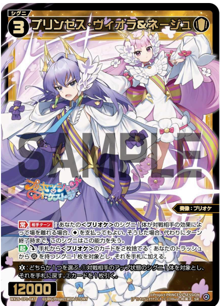
プリンセス・ヴィオラ&ネージュ 白 シグニ レベル3 <奏像：プリオケ> パワー12000

A：いいえ、できません。ルリグの最初のアタックで、2体のこのシグニの自動能力は両方ともトリガーし、発動します。手札を捨て《無》を支払うことを選ばなかったとしても、発動はしますのでターン1回制限のあるこの能力は、このターンはもう発動しません。