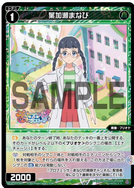
葉加瀬まなび 緑 シグニ レベル1 <奏像：プリオケ> パワー2000

【自】：あなたのターン終了時、あなたのデッキの一番上を公開する。そのカードがレベル2以下の<プリオケ>のシグニの場合、【エナチャージ1】をする。