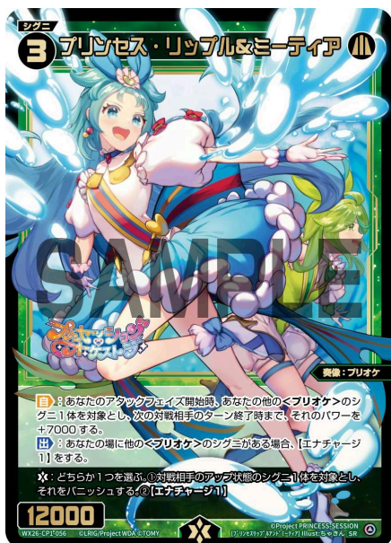
プリンセス・リップル&ミーティア 緑 シグニ レベル3 <奏像：プリオケ> パワー12000

【起】エナゾーンから<プリオケ>のカード2枚をトラッシュに置く：ターン終了時まで、このシグニは【Sランサー】を得る。（【Sランサー】を持つシグニがバトルでシグニをバニッシュしたとき、対戦相手のライフクロスがある場合はそれを1枚クラッシュする。無い場合は対戦相手にダメージを与える）