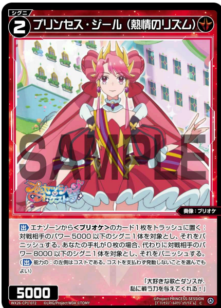
プリンセス・ジール (熱情のリズム) 赤 シグニ レベル2 <奏像: プリオケ> パワー5000

【起】 このシグニを場からトラッシュに置く: あなたの手札から《プリンセス・ジール (テイクミーハイヤー)》1枚を場に出す。