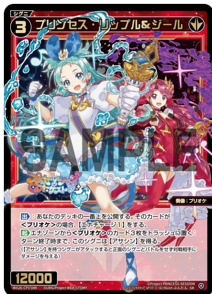
プリンセス・リップル&ジール 赤 シグニ レベル3 <奏像：プリオケ> パワー12000

【出】：あなたのデッキの一番上を公開する。そのカードが<プリオケ>の場合、【エナチャージ1】をする。