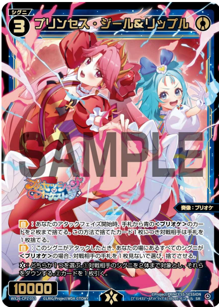
プリンセス・ジール&リップル 青 シグニ レベル3 <奏像：プリオケ> パワー10000

【自】：あなたのアタックフェイズ開始時、手札から青の<プリオケ>のカードを2枚まで捨てる。この方法で捨てたカード1枚につき対戦相手は手札を1枚捨てる。