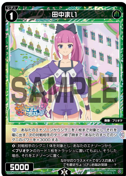
田中まい 緑 シグニ レベル1 <奏像：プリオケ> パワー5000

A：シグニには【歌のカケラ】アイコンを持つ能力があることがあります。【歌のカケラ】アイコンを持つ能力は、それ単体では効果は無く、特定のルリグの「【歌のカケラ】を使用する」効果で使用することができます。