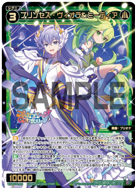
プリンセス・ヴィオラ&ミーティア 緑 シグニ レベル3 <奏像：プリオケ> パワー10000

A: はい、このシグニ1体だけだった場合も「あなたの場にあるすべてのシグニが<プリオケ>」であるという条件は満たしています。