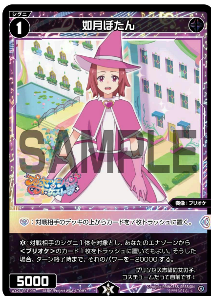
如月ぼたん 黒 シグニ レベル1 <奏像：プリオケ> パワー5000

A：シグニには【歌のカケラ】アイコンを持つ能力があることがあります。【歌のカケラ】アイコンを持つ能力は、それ単体では効果は無く、特定のルリグの「【歌のカケラ】を使用する」効果で使用することができます。