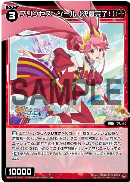
プリンセス・ジール (決意完了!) 赤 シグニ レベル3 <奏像：プリオケ> パワー10000

【出】 エナゾーンから<プリオケ>のカード1枚をトラッシュに置く：対戦相手のパワー8000以下のシグニ1体を対象とし、それをバニッシュする。あなたの手札が0枚の場合、代わりに対戦相手のパワー10000以下のシグニ1体を対象とし、それをバニッシュする。