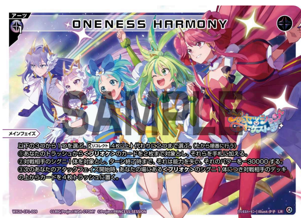
ONENESS HARMONY 黒 アーツ 《黒》×1 メインフェイズ

A：その場合、ダメージを【ルリグバリア】によって防ぐか、この効果によって防ぐかを宣言し、選んだ方で防ぐことができます。例えばこの効果によって防いだ場合、【ルリグバリア】は消費されず残ります。