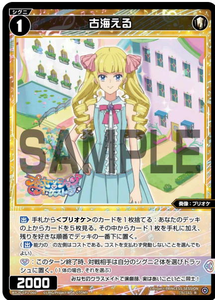
古海える 白 シグニ レベル1 <奏像：プリオケ> パワー2000

【出】手札から<プリオケ>のカードを1枚捨てる：あなたのデッキの上からカードを5枚見る。その中からカード1枚を手札に加え、残りを好きな順番でデッキの一番下に置く。 (【出】能力の：の左側はコストである。コストを支払わず発動しないことを選んでもよい)