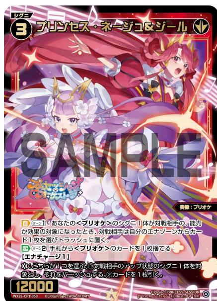
プリンセス・ネージュ&ジール 赤 シグニ レベル3 <奏像：プリオケ> パワー12000

（【アサシン】を持つシグニがアタックすると正面のシグニとバトルをせず対戦相手にダメージを与える）