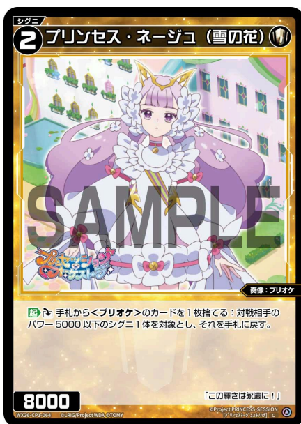
プリンセス・ネージュ (雪の花) 白 シグニ レベル2 <奏像：プリオケ> パワー8000

A：いいえ、この自動能力が発動したときにあなたの場にある<プリオケ>のシグニのみが+2000されます。