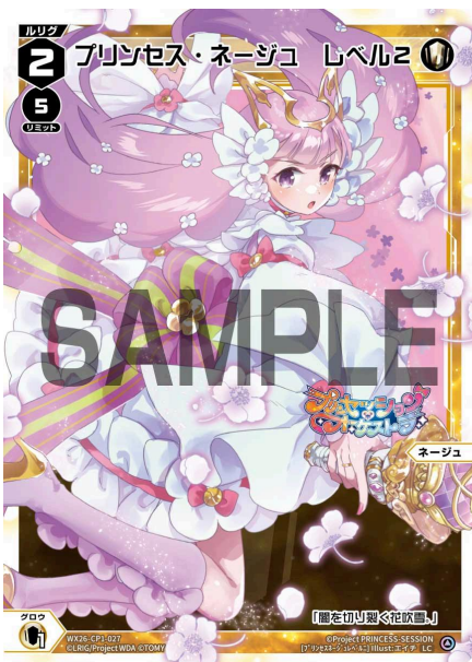
プリンセス・ネージュ レベル2 <ネージュ> 《白》×1