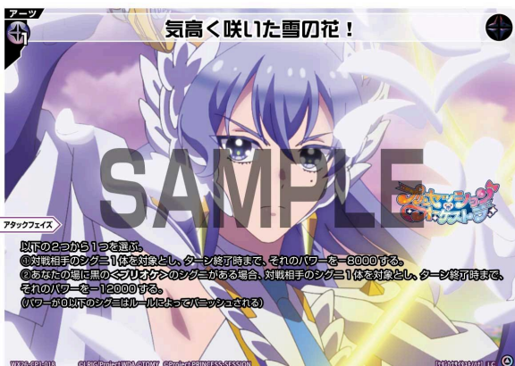
気高く咲いた雪の花！ 黒 アーツ 《黒》×1 アタックフェイス