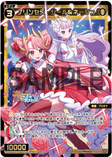
プリンセス・ジール&ネージュ 白 シグニ レベル3 <奏像：プリオケ> パワー10000

A：いいえ、失いません。この出現時能力は、発動時に対戦相手の場にあるシグニの能力のみを失わせます。