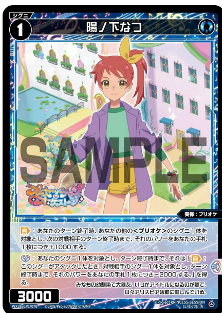
陽ノ下なつ 青 シグニ レベル1 <奏像：プリオケ> パワー3000

(【出】能力の：の左側はコストである。コストを支払わず発動しないことを選んでもよい)