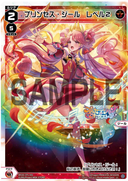
プリンセス・ジール レベル2 <ジール> 《赤》×1