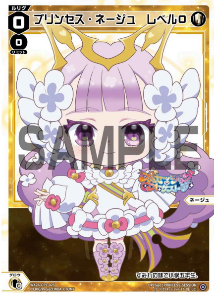
プリンセス・ネージュ レベル0 <ネージュ> 《白》×0