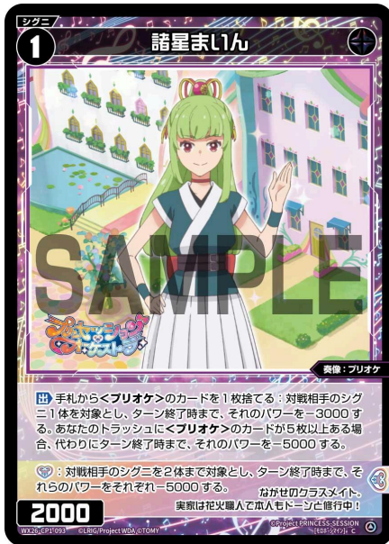
諸星まいん 黒 シグニ レベル1 <奏像：プリオケ> パワー2000

【出】手札から<プリオケ>のカードを1枚捨てる：対戦相手のシグニ1体を対象とし、ターン終了時まで、そのパワーを-3000する。あなたのトラッシュに<プリオケ>のカードが5枚以上ある場合、代わりにターン終了時まで、そのパワーを-5000する。