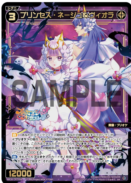
プリンセス・ネージュ&ヴィオラ 黒 シグニ レベル3 <奏像：プリオケ> パワー12000

A：はい、エナコストを支払った後にトラッシュにある<プリオケ>のカードを数え、マイナスします。また、その後はトラッシュの枚数が変動したとしても、この効果で与えたマイナスの値は変動しません。