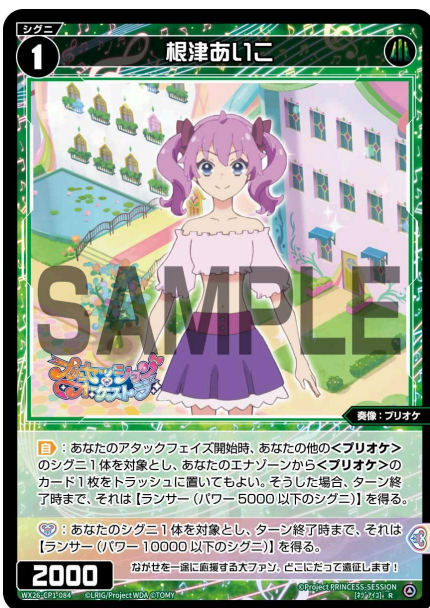
根津あいこ 緑 シグニ レベル1 <奏像：プリオケ> パワー2000

【起】《ダウン》手札から<プリオケ>のカードを1枚捨てる：対戦相手のシグニ1体を対象とし、ターン終了時まで、そのパワーを-8000する。 (パワーが0以下のシグニはルールによってバニッシュされる)