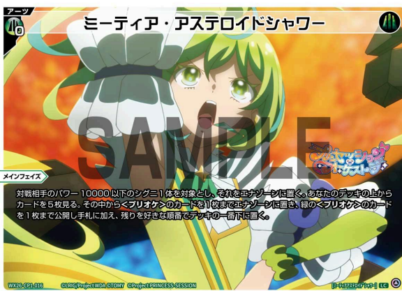
ミーティア・アステロイドシャワー 緑 アーツ 《緑》×0 メインフェイス

対戦相手のパワー10000以下のシグニ1体を対象とし、それをエナゾーンに置く。あなたのデッキの上からカードを5枚見る。その中から<プリオケ>のカードを1枚までエナゾーンに置き、緑の<プリオケ>のカードを1枚まで公開し手札に加え、残りを好きな順番でデッキの一番下に置く。