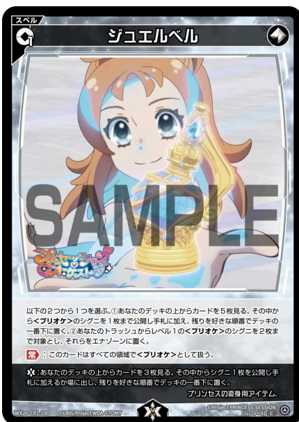
ジュエルベル 無 スpell 《無》×1

【出】 エナゾーンから<プリオケ>のカード1枚をトラッシュに置く：対戦相手のシグニ1体を対象とし、ターン終了時まで、そのパワーを-8000する。 （【出】能力の：の左側はコストである。コストを支払わず発動しないことを選んでもよい）