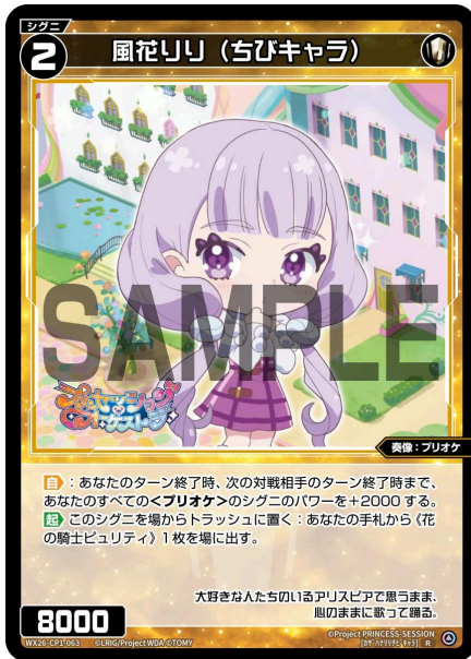
風花りり (ちびキャラ) 白 シグニ レベル2 <奏像：プリオケ> パワー8000

【自】：あなたのターン終了時、次の対戦相手のターン終了時まで、あなたのすべての<プリオケ>のシグニのパワーを+2000する。