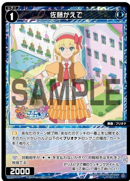
佐藤かえで 青 シグニ レベル1 <奏像：プリオケ> パワー2000

A：シグニには【歌のカケラ】アイコンを持つ能力があります。【歌のカケラ】アイコンを持つ能力は、それ単体では効果は無く、特定のルリグの「【歌のカケラ】を使用する」効果で使用することができます。