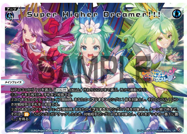
Super Higher Dreamer!!! 青 アーツ 《青》×1 メインフェイズ

以下の3つから1つを選ぶ。《リコレクトアイコン》 [4枚以上] 代わりに2つまで選ぶ。(上から順番に行う)