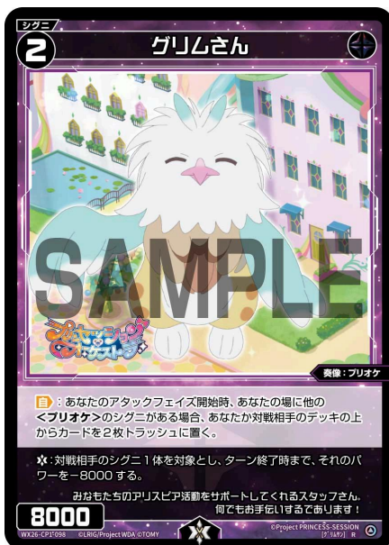
グリムさん 黒 シグニ レベル2 ＜奏像：プリオケ＞ パワー8000

【ライフバースト】：このターン、次にあなたがダメージを受ける場合、代わりにあなたのデッキの上からカードを3枚トラッシュに置く。(デッキが2枚以下の場合は置き換えられない)