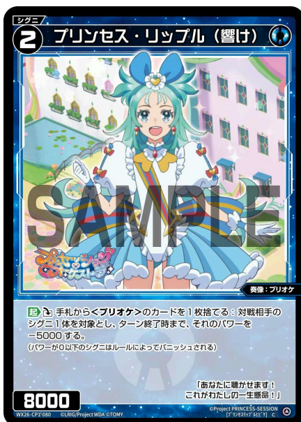
プリンセス・リップル (響け) 青 シグニ レベル2 <奏像：プリオケ> パワー8000

【起】このシグニを場からトラッシュに置く：あなたの手札から《プリンセス・リップル (テイクミーハイヤー)》1枚を場に出す。