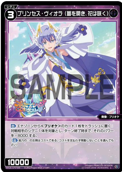
プリンセス・ヴィオラ（蕾を開き、花は咲く） 黒 シグニ レベル3 <奏像：プリオケ> パワー10000

【出】 エナゾーンから<プリオケ>のカード1枚をトラッシュに置く：対戦相手のシグニ1体を対象とし、ターン終了時まで、そのパワーを-8000する。 （【出】能力の：の左側はコストである。コストを支払わず発動しないことを選んでもよい）