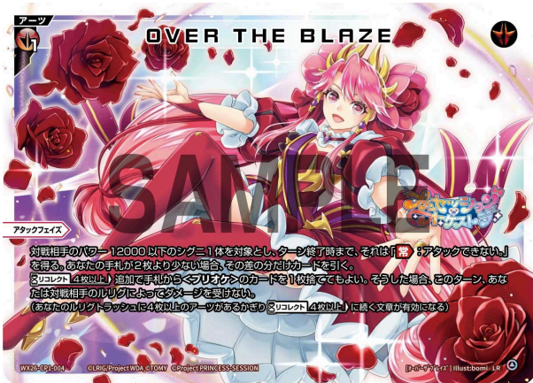
OVER THE BLAZE 赤 アーツ 《赤》×1 アタックフェイズ

A：次のあなたのアタックフェイズ開始時にこの効果がトリガーし、発動する時となります。発動時に<プリオケ>のシグニ1体を対象とし、そこでどちらかを選んで能力を得させます。