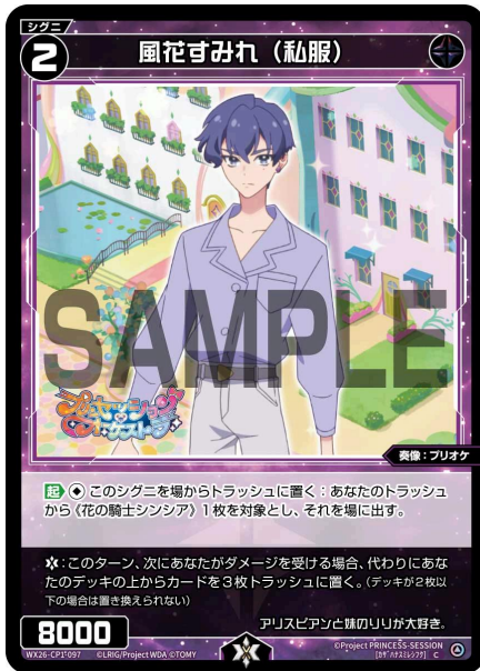
風花すみれ (私服) 黒 シグニ レベル2 ＜奏像：プリオケ＞ パワー8000

【起】《無》このシグニを場からトラッシュに置く：あなたのトラッシュから《花の騎士シンシア》1枚を対象とし、それを場に出す。