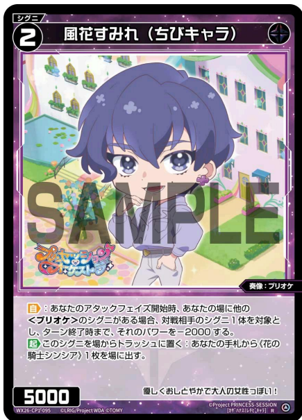
風花すみれ (ちびキャラ) 黒 シグニ レベル2 <奏像：プリオケ> パワー5000

A：その場合、残りのデッキをすべてトラッシュに置きます。その後、デッキが0枚ですのでリフレッシュを行います。