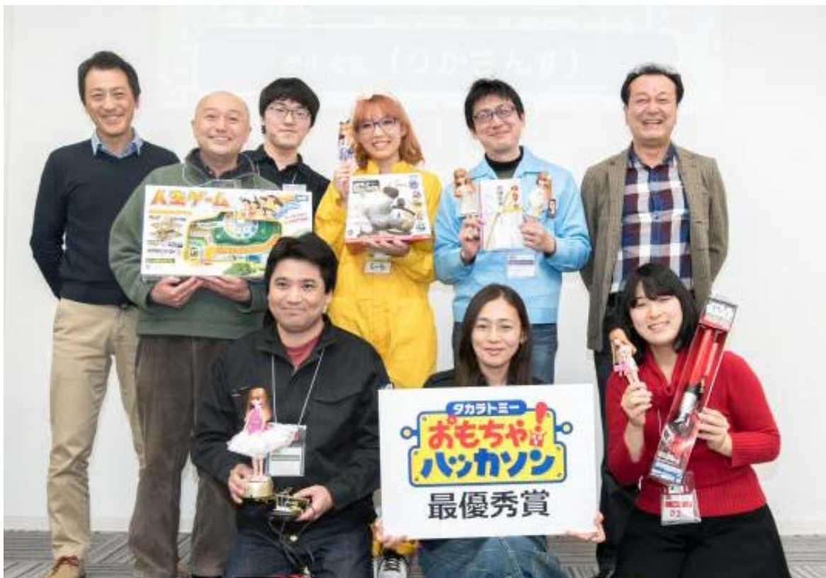
▲最優秀賞受賞チーム「りかさんず」と審査員