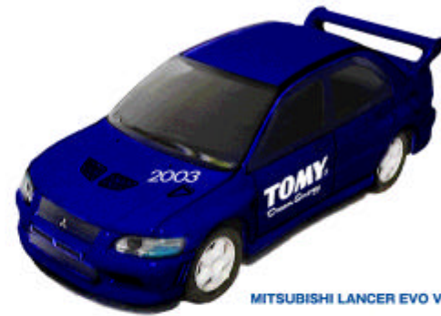
MITSUBISHI LANCER EVO VII