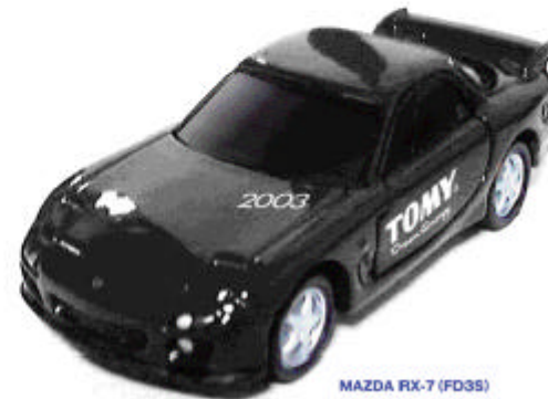
MAZDA RX-7 (FD3S)