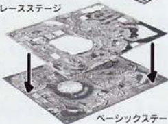
ベーシックステージ