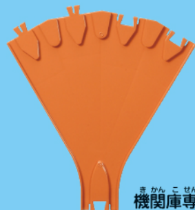
機関庫専用レール