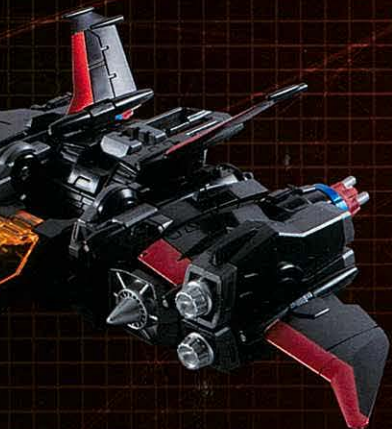
フレキシブルアームマウント

優れた操縦性を持つ高速飛行戦闘マシン。腕部武装ユニット+空中機動ブースターとそれらを制御する単座型ボレットモジュール機で構成。腕部武装ユニットは多数の機能別オプションがあり、作戦内容により選択・換装を行う。