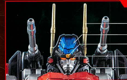
コズミックセンサー