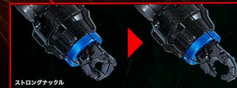
ストロングナックル