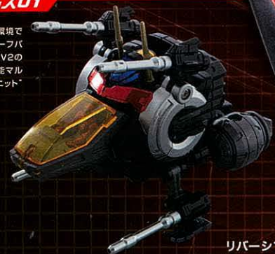
リバーシブル ブースター

宇宙空間から海底まであらゆる環境で活動可能な万能戦闘マシン。チーフパイロットが操縦するダイアバトルスV2のコアとなる。機体中央部に高性能マルチセンサーの集合体「ヘッドユニット」が格納されている。