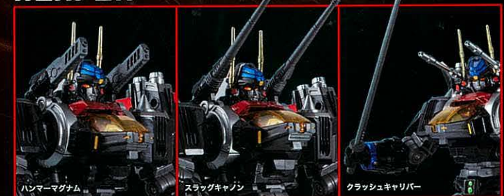
ハンマーマグナム