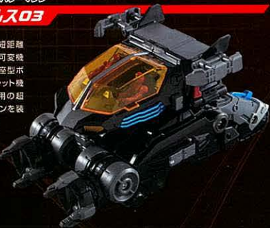
フリーゾンニトロ噴射装置

陸上攻撃用ハイパワーマシン。短距離であれば空中機動も可能。脚部可変機動ユニットとそれを制御する複座型ボレットモジュール機で構成。ボレット機の後部格納庫に地上攻撃支援用の超高速戦闘マシンライドファルコンを装備。脚部機動ユニットは多数の機能別オプションがあり、作戦内容により選択・換装を行う。