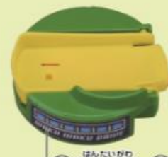
■くるくるエレベーター