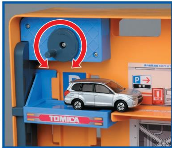
エレベーターで立体駐車場へGO!