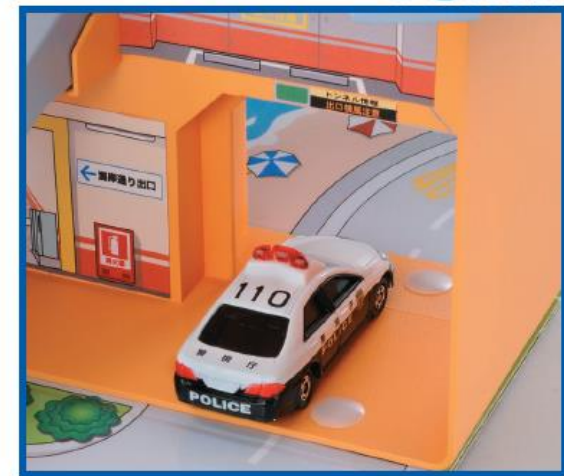
ゲートをくぐると海が見えるよ!