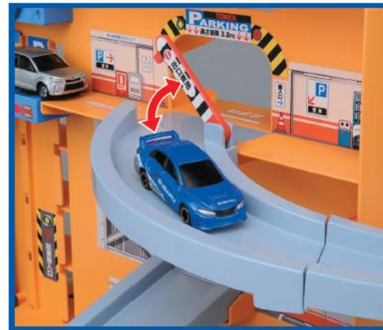
ループ道路で街へ飛び出そう!