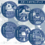
スタートポケモンチップ

スタートポケモンはスタート時にすでにプレイヤーが持っているポケモンチップです。全部で6枚あります。「チコリータ」「ヒノアラシ」「ワニノコ」「フシギダネ」「ヒトカゲ」「ゼニガメ」の中から好きなものを1枚選んで、ゲームをスタートしてください。なお、チップがあまった場合、そのチップは「ピンクポケモン」としてゲームに使います。ピンクポケモンチップの山に加えてよくきってください。