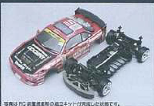
写真はRC車両組み立て時の組立キットが完成した状態です。